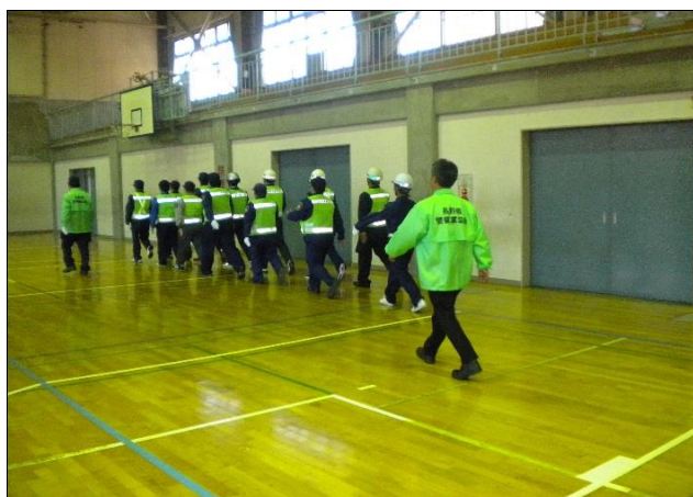
《部隊訓練実施状況1》